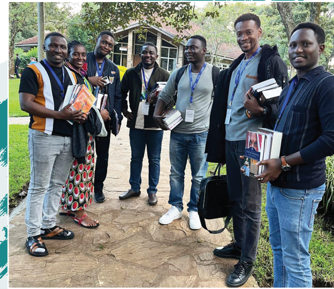
Résidents de la PAACS.

Le terme « synergie » est un mot à la mode très en vogue. Il est facile de l'utiliser dans une phrase sans réfléchir à sa véritable signification. Bien sûr, Synergie Francophone ne l'utilise pas comme un mot à la mode. Nous incarnons cette idée dans notre collaboration avec d'autres ministères, comme l'Académie panafricaine des chirurgiens chrétiens (PAACS).