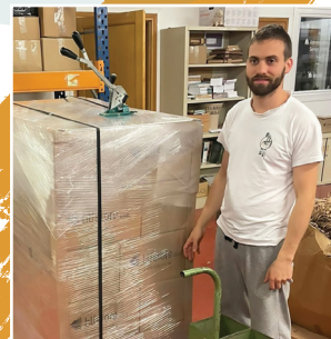
Palette de livres chez BLF Éditions, prête à être expédiée.