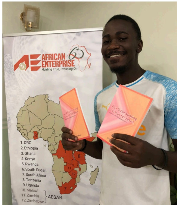
Formation à l'impression à la demande (à gauche) et un stagiaire tenant son premier livre imprimé (à droite)