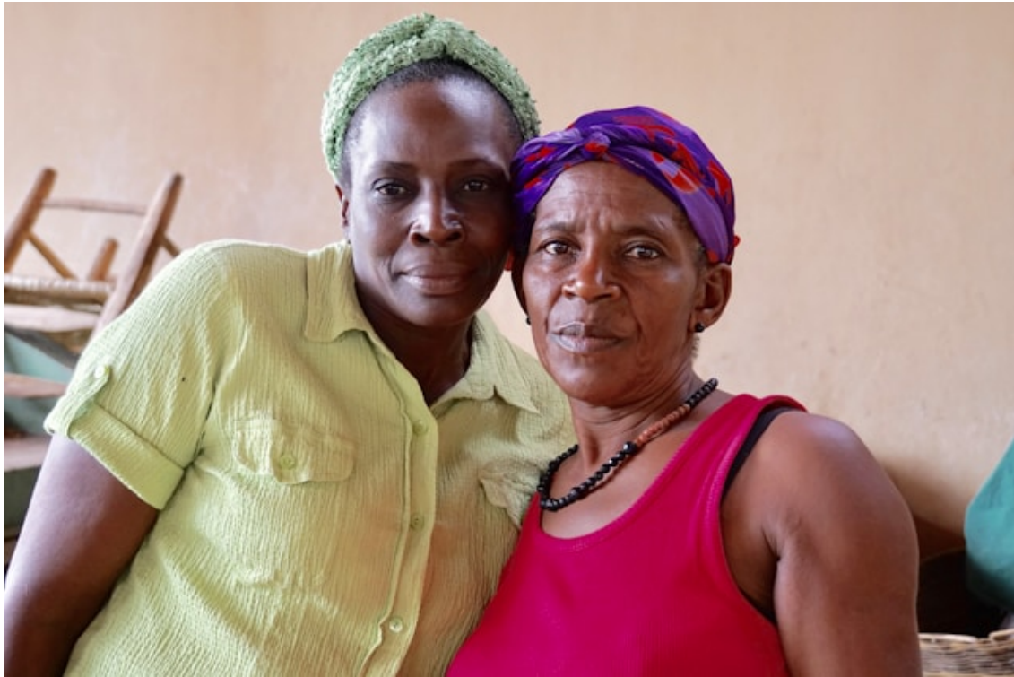
Deux femmes haïtiennes sur un marché de Port-au-Prince en 2020