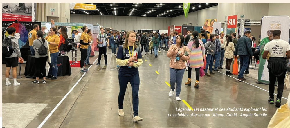
Légende : Un pasteur et des étudiants explorant les possibilités offertes par Urbana.

francophonie, ainsi que quelques personnes qui voulaient en savoir plus. C'est presque toujours une grande découverte pour les gens d'apprendre qu'une grande partie du monde utilise le français, et qu'il est parlé par 321 millions de personnes - et cela ne cesse de croître !