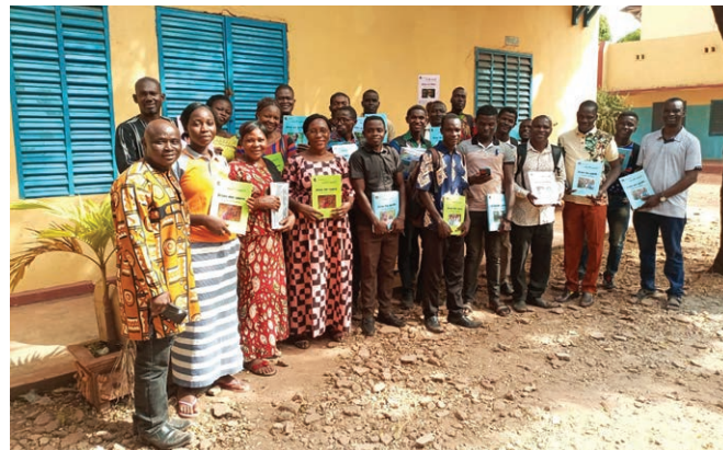
Légende : Les enseignants de l'école du dimanche à une des conférences de formation au Burkina Faso.

Plusieurs milliers d'exemplaires de nos manuels d'enseignement pour l'école du dimanche ont été envoyés à trois pasteurs du Burkina Faso qui ont organisé plusieurs formations pour les enseignants de l'école du dimanche. En février, les exemplaires imprimés restants de notre programme d'enseignement du dimanche, soit environ deux palettes, ont été expédiés de France à Haïti.