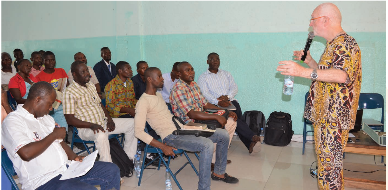
Légende : Alain Stamp forme des leaders à Brazzaville en République du Congo.