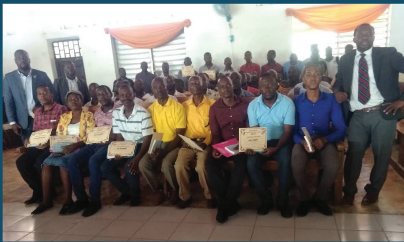
Ayant reçu de la littérature en français pendant leurs études, les diplômés haïtiens de l'école biblique sont prêts à enseigner la Parole de Dieu dans leurs communautés.

Rice a expliqué que l'engagement de SF envers les autres est motivé par le mandat suprême tel que présenté dans Matthieu 28, ainsi que par le besoin de littérature chrétienne en Afrique, en Haïti et ailleurs. « Dieu utilise SF pour répondre à ces besoins, en particulier pour les jeunes évangélistes et pasteurs » a-t-il déclaré. Les histoires de ceux qui ont développé leurs communautés locales en utilisant les ressources fournies par SF démontrent le fruit de l'Esprit , qui n'a cessé de croître au fur et à mesure que la portée de SF s'étend dans le monde francophone.