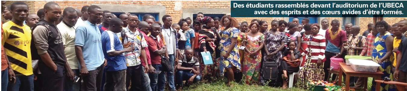
Des étudiants rassemblés devant l'auditorium de l'UBECA avec des esprits et des cœurs avides d'être formés.